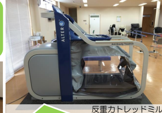
反重カトレッドミル

自転車型の運動機械です。ペダルをこくと、運動量が表示されます。負荷を設定できるので、無理なく有酸素運動が行えます。