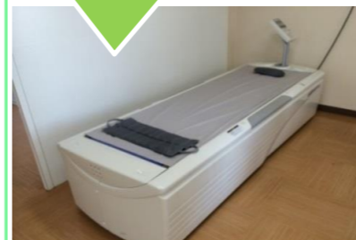
ウォーターベッド

水の流体特性を応用し、「手技療法」と同様の力強く・心地よい刺激を体を与え、マッサージします。