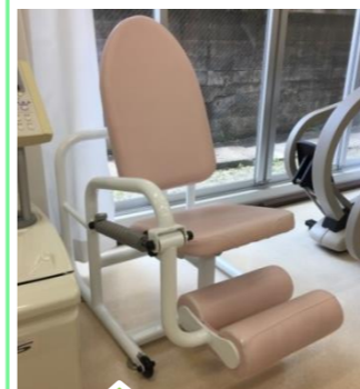
レッグエクステンション